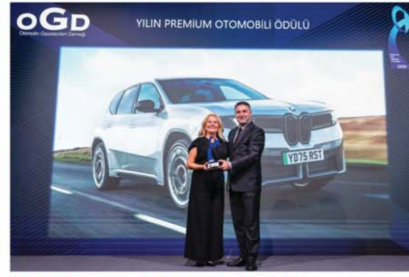
"Yılın Premium Otomobili" BMW iX3