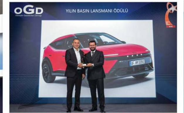
"Yılın Basın Lansmanı" Hyundai EV Tech Day