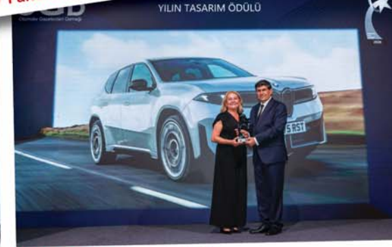
"Yılın Tasarımı" BMW iX3