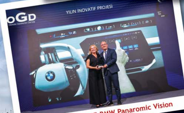
"Yılın İnovatif Projesi" BMW Panoramic Vision